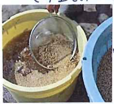
塩水で種まみを選ん...