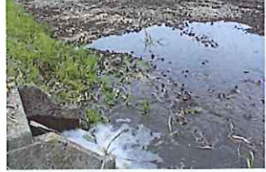
水を入れ 草をはやし...