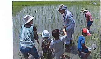
林先生, 関口先生の 生き物の調査