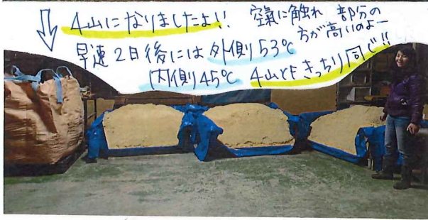
4山になりました!! 空気触れ部分の方が高いよー 早速2日後には外側53℃ 内側45℃ 4山でまち同!!

外側10cmは空気好きな菌が スゴク多い!! にびり!! 層にならず!! 内は空気嫌いな菌が別な印が!!