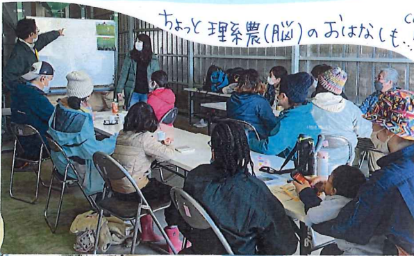
ちよと理系農(脳)のおはなし。ca. Mg, K