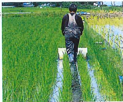
スタック"除草機"をかけてくれました。