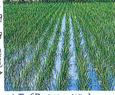
水面が見えてます...(1ヶ月)