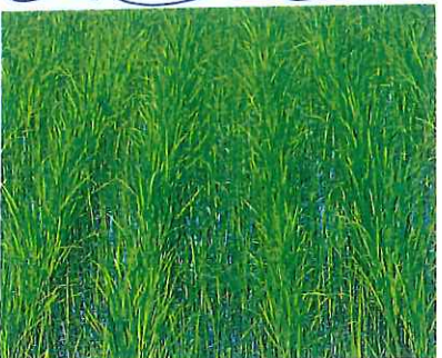
ぎやあ!! (この部分だけなんですわ)