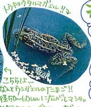
こちらは... なんとアマガエルの下まご!! 直径50~60mmくらいのマゴ。 夕べのオコシはいいね... すげい。