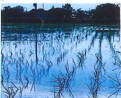
お天行はいいんですが...