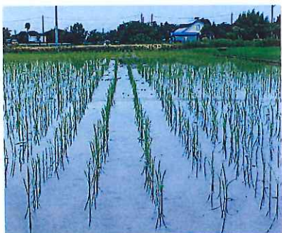
5日もすると根がいてピン!! と立ちあ