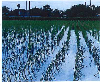
すでに草の葉が"ぼちぼちぼち..."