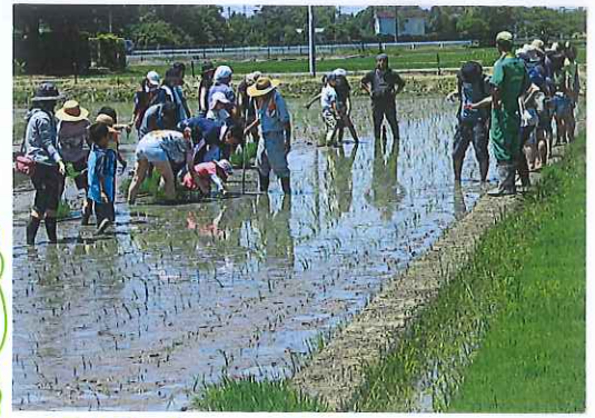
「順調に育っていますヨ!!」