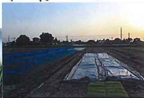
金色シートの中は...