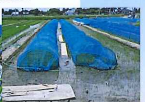
青色の防鳥虫ネットの中では...