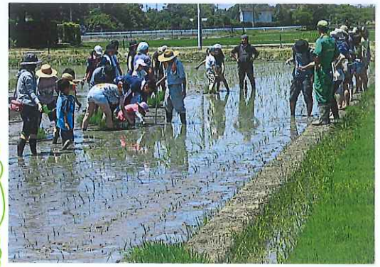
「順調に育っていますヨ!!」