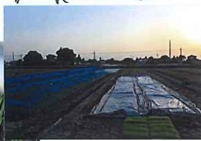
銀色シートの中では...