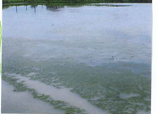
繁殖しましたヨ!! これも田んぼの養分!!