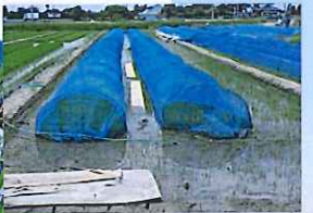
青色の防鳥虫ネットの中は...